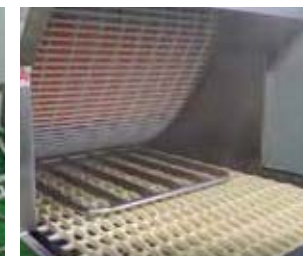
丸洗い出来るので便利です

出来るだけシンプル な形にし、汚れがた まりにくく、丸洗い 出来るのは大きな ポイントです！